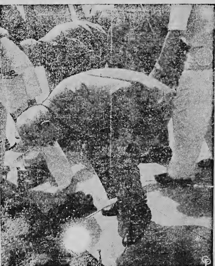
VOOR DE AMERIKAANSE Minister van Buitenlandse Zaken, John Foster Dulles suit India vertrok, met bestemming Pakistan, legde hij een krans aan de voet van het monument van Ghandi. In overeenstemming met het plaatselijk gebruik trok Dulles, voor hij de gewijde grond van Raigat, waar Ghandi's as bewaard wordt, zijn schoenen uit.